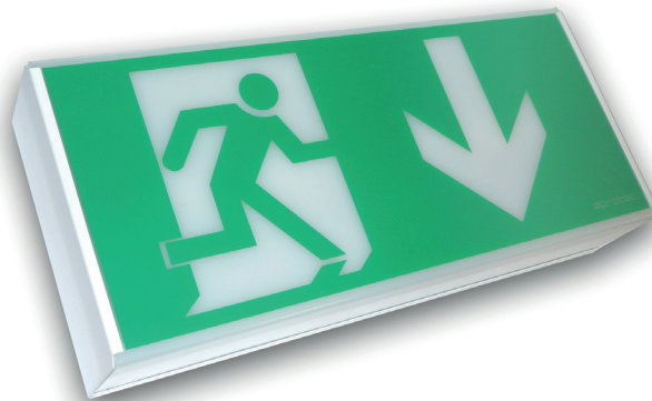
Pictogramme fourni séparément